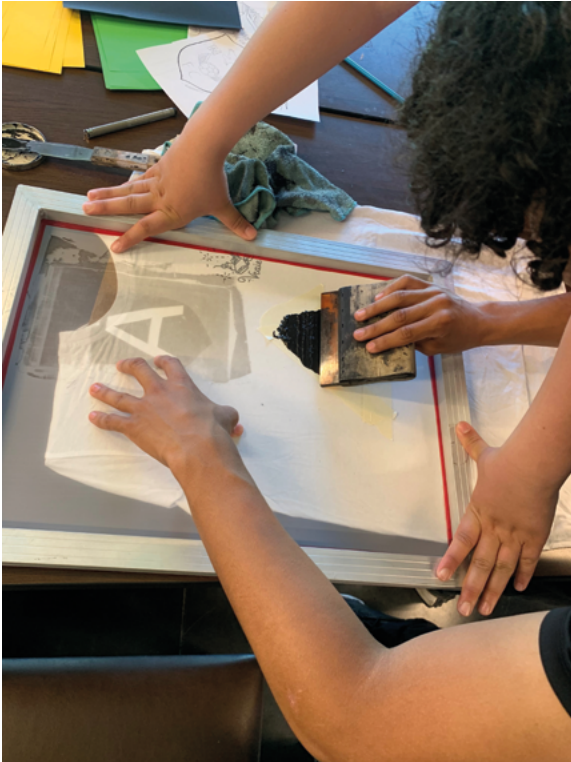
« Tribunal des préjugés », un des 8 projets « Résilience » : atelier socio-créatif sur la thématique identité et espace public, en partenariat avec l'ASBL FEFA (Football-Etudes-Familles) à Anderlecht.