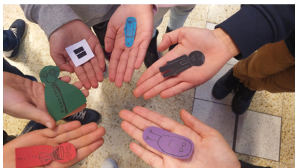
« Tous différents mais égaux » (projet « La diversité dans tous ses états », dans le cadre de la participation).