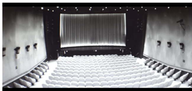
Photo 1 : Extrait de la séquence filmée au cinéma Le Parc à Liège.

Et pour plus d'informations : www.zetetiquetheatre.be