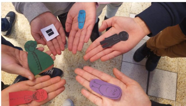
« Tous différents mais égaux » (projet « La diversité dans tous ses états »).

Le projet s'est clôturé en juin 2023. Un site rassemble les réalisations : www.danstoussesetats.be .